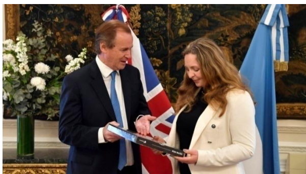
El gobernador Bordet junto a la embajadora del Reino Unido, Kirsty Hayes

Y como de negocios se trata, y a veces las guerras complican las exportaciones, se lo ha visto al gobernador salir de gira por Europa y sin ponerse colorado, rendir pleitesías a la embajadora del Reino Unido para ofrecer las bondades de la producción de la citricultura entrerriana, flanqueado por la bandera inglesa que sigue clavada en el corazón de nuestras Malvinas.