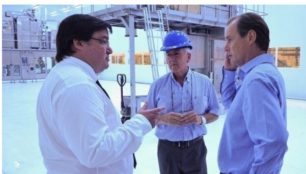
El gobernador Bordet, en una de sus visitas a la planta de Baggio SA

Es quien ha acompañado en varias oportunidades al gobernador de la provincia de Entre Ríos, Gustavo Bordet, en las visitas que ha realizado a la planta industrial que posee el grupo en la localidad de Gualeguaychú. El gobernador cada vez que puede la pone de ejemplo de “producción primaria con agregado de valor”. Una verdadera radiografía de las aspiraciones de una clase política resignada a conformarse con las migajas de un modelo que traba la posibilidad de un verdadero desarrollo industrial integral, soberano y ambientalmente sustentable.